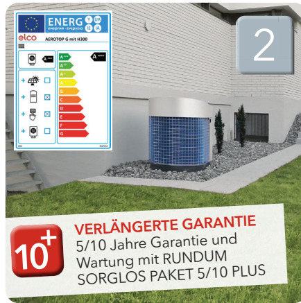
AEROTOP® G Luft-Wasser Wärmepumpe