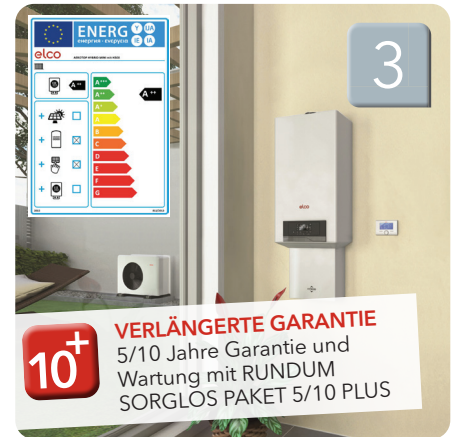
AEROTOP® HYBRID UNIVERSAL Hybridsystem: Wärmepumpe mit Gas-Brennwertkessel