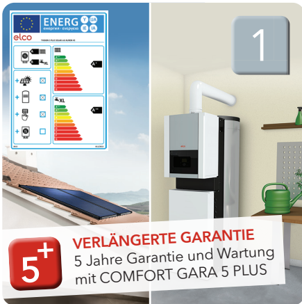
THISION® S PLUS Gas-Brennwertkessel mit Flachkollektor

Veraltete Heizanlagen verbrauchen nicht nur viel Energie, auch die Auswirkungen hoher Stickstoffoxid-Emissionen (NOx) stellen eine Gefahr für die Gesundheit dar und schädigen die Umwelt. ELCO hat heute schon die nachhaltigen Heizlösungen von morgen. Hier drei klassische Sanierungslösungen: