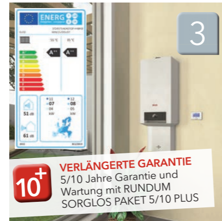
AEROTOP® HYBRID MINI Hybridsystem: Wärmepumpe mit Gas-Brennwertkessel