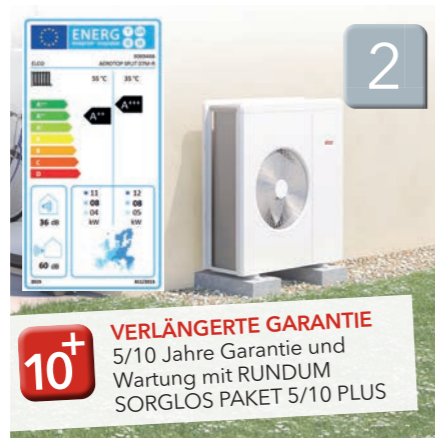
AEROTOP® SPLIT Luft-Wasser Wärmepumpe