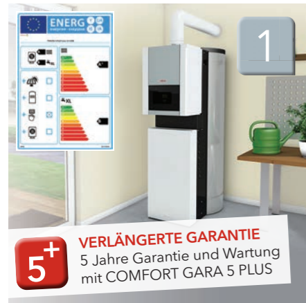
THISION® S PLUS Solar V Gas Stand-Brennwertkessel mit Solar

Veraltete Heizanlagen verbrauchen nicht nur viel Energie, auch die Auswirkungen hoher Stickstoffdioxid-Emissionen (NOx) stellen eine Gefahr für die Gesundheit dar und schädigen die Umwelt. ELCO hat heute schon die nachhaltigen Heizlösungen von morgen: Die NOx Emissionen unserer Premium Gasgeräte liegen bis zu 60 % unter dem EU Grenzwert. Und in Kombination mit unseren Wärmepumpen sind Sie für die Zukunft bestens gewappnet. Hier drei klassische Sanierungslösungen: